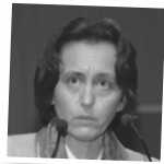
Beatrix von Storch

«Wenn wir kommen, dann wird aufgeräumt, dann wird ausgemistet, dann wird wieder Politik für das Volk und zwar nur für das Volk gemacht. Denn wir sind das Volk, liebe Freunde!»