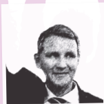
Björn Höcke Vorsitzender der

Stellv. Vorsitzende Bundestagsfraktion «Wieso twittert eine offizielle Polizeiseite aus NRW auf Arabisch. Meinen Sie, die barbarischen, muslimischen, gruppenvergewaltigenden Männerhorden so zu besänftigen?»