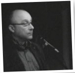
Jens Maier AfD MdB, Sachsen

«Wenn ich durch das Zentrum meiner Stadt gehe [...] sehe ich nur noch vereinzelt Deutsche. Und das Schlimme ist, dass sich dieser Zustand in den kommenden Jahren noch verschlimmern wird...»