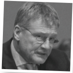
Jörg Meuthen Parteivorsitzender

Ziel der AfD ist eine grundlegende Veränderung der Gesellschaft nach rechts. Rassist*innen, Neonazis, Antisemit*innen und rechte Schläger*innen haben sich in der AfD vereint. Quellen für die Zitate: www.aufstehen-gegen-rassismus.de/quellen