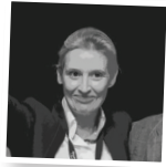
Alice Weidel Fraktionsvorsitzende

«Die Zuwanderung ist eine als humanistisch getarnte Selbsterstörung der deutschen Kultur und Nationalität»