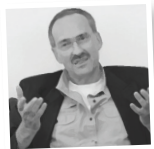
Roman Reusch AfD MdB, Brandenburg

«Der Islam ist eine Konstruktion, die selbst die Religionsfreiheit nicht kennt und diese nicht respektiert. [...] Und wer so mit einem Grundrecht umgeht, dem muss man das Grundrecht entziehen.»