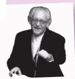
Martin Renner AfD MdB

«Wir werden definitiv dafür sorgen, dass das Gender nicht in bayrische Schulen einzieht! [...] Es gibt einen Mann, es gibt eine Frau, aber keinen Es.»