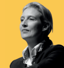
Königsmacherin und Feigenblatt