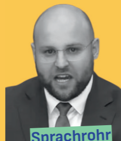
Sprachrohr des Kremls